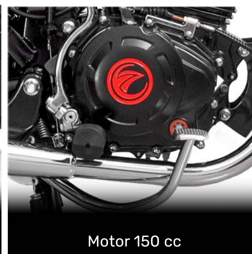
Motor 150 cc