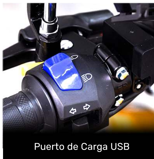
Puerto de Carga USB