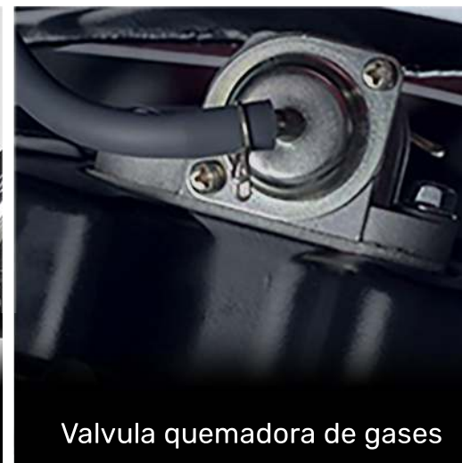
Valvula quemadora de gases